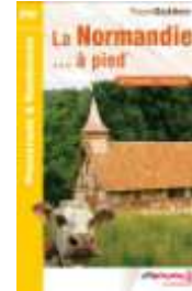
La Normandie ...à Pied Edition 2007

Pays d'Auge, vallée de la Seine, forêts de l'Eure..., les plus belles balades régionales. 50 balades