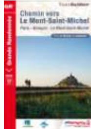
Chemin vers le Mont St Michel Edition 2012

Itinéraire historique du Parvis de la Cathédrale Notre Dame de Paris à L'abbaye du Mont Saint Michel. GR®22 - 580 km