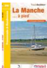
La Manche... à pied Edition 2017

Sables et roches, de la baie du Mont St Michel aux marais du Cotentin. 51 balades