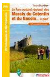
Le PNR des Marais du Cotentin et du Bessin ...à pied Edition 2015

Au cœur de la presqu'île du Cotentin, le bocage domine mais c'est la zone humide qui a forgé le caractère du Parc. Au fil des saisons, ces marais entre deux mers offrent en Normandie un espace privilégié de balades 33 balades