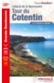
Tour du Cotentin Edition 2019

Dunes, plages et côtes sauvages, d'Isigny-sur-Mer au Mont St Michel GR223/GRP-480 km